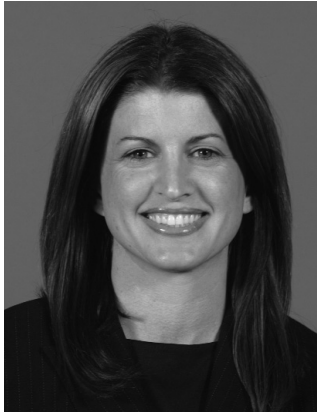
L'honorable Rona Ambrose, présidente du Conseil privé de la Reine pour le Canada, ministre des Affaires intergouvernementales et ministre de la Diversification de l'économie de l'Ouest canadien