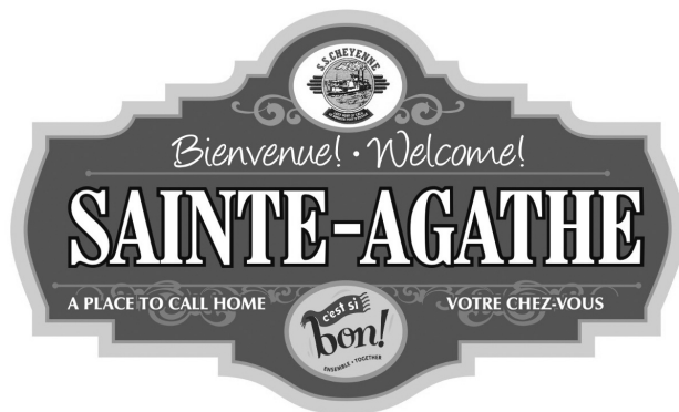
Promotion de l'image de marque C'est si bon à Sainte-Agathe

L'Agence nationale et internationale du Manitoba (ANIM) est un nouvel organisme sans but lucratif mis sur pied par la Société franco-manitobaine. L'ANIM offre ses services aux organisations du Manitoba qui souhaitent accroître leur présence sur les marchés francophones. L'Agence s'efforce également d'attirer au Manitoba des investisseurs et des gens d'affaires de pays de la Francophonie. L'ANIM travaille activement à la réalisation de ces objectifs en embauchant des consultants pour élaborer des lignes directrices sur le travail avec les entreprises et offrir leur expertise dans des domaines comme la recherche, le réseautage, le marketing et la planification de l'exportation. Grâce à un ensemble de rencontres avec le consul général de France et d'importantes personnes-ressources du milieu manitobain des affaires, l'ANIM a pu se faire une réputation d'organisation dynamique et pertinente dans l'économie du Manitoba. Des missions économiques en France, en Belgique et en Tunisie ont permis de renforcer les partenariats actuels et d'en établir de nouveaux avec des organisations clés. L'ANIM a lancé son site Web en décembre 2007, et une version en anglais sera lancée sous peu. Pour obtenir plus de renseignements sur les activités et les services offerts par l'ANIM, veuillez consulter son site Web à www.animcanada.com .